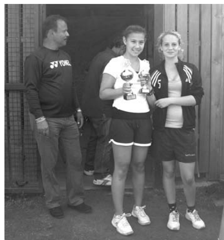
... Sieger gab es natürlich auch. Die schmucken Pokale werden nun die Zimmer zieren.