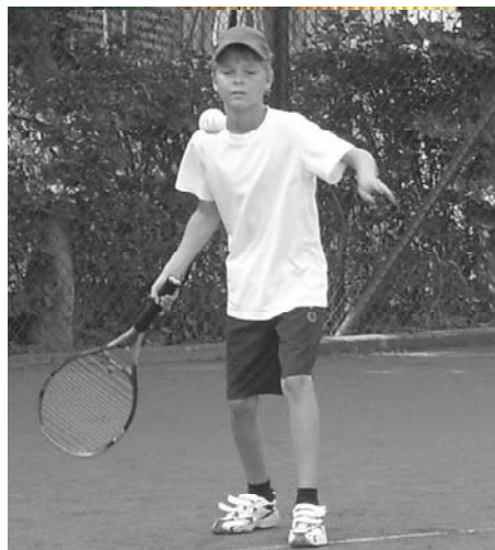
Zuerst kamen alle Teilnehmer ganz schön ins Schwitzen ...

Gut, fast pünktlich, um viertel vor Elf beginnen wir, statt mit 35, immer noch mit 31 Aktiven.