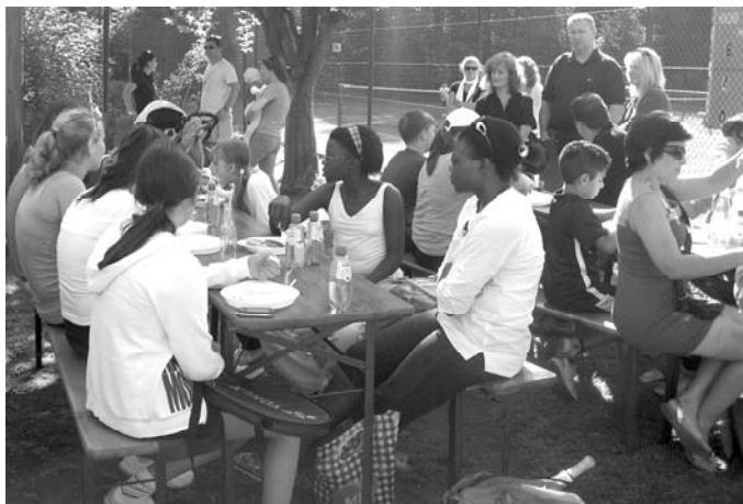
... dann durften sich alle an den reichlich vorhandenen Leckereien stärken.

Doch die Gewinner waren die Kinder. Nicht wegen der glänzenden Trophäe,