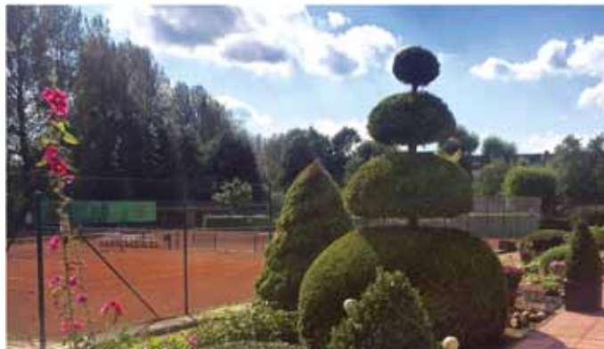
Eine der schönsten Tennisanlagen Hamburgs liegt am Tegelweg

DIE TENNISABTEILUNG DES FTV SUCHT ZUM APRIL 2021 EINEN NEUEN PLATZWART.