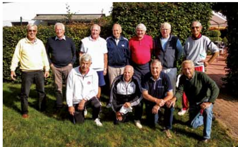
Hier unsere Cracks nach dem letzten Punktspiel mit den Gästen vom Tennispark Witthöft

Insgesamt sind in der Sommersaison 2020 aus einem Kader von 13 Spielern sechs zum Einsatz gekommen: