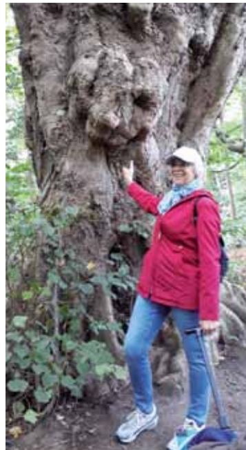
Ein Baum mit Charakter