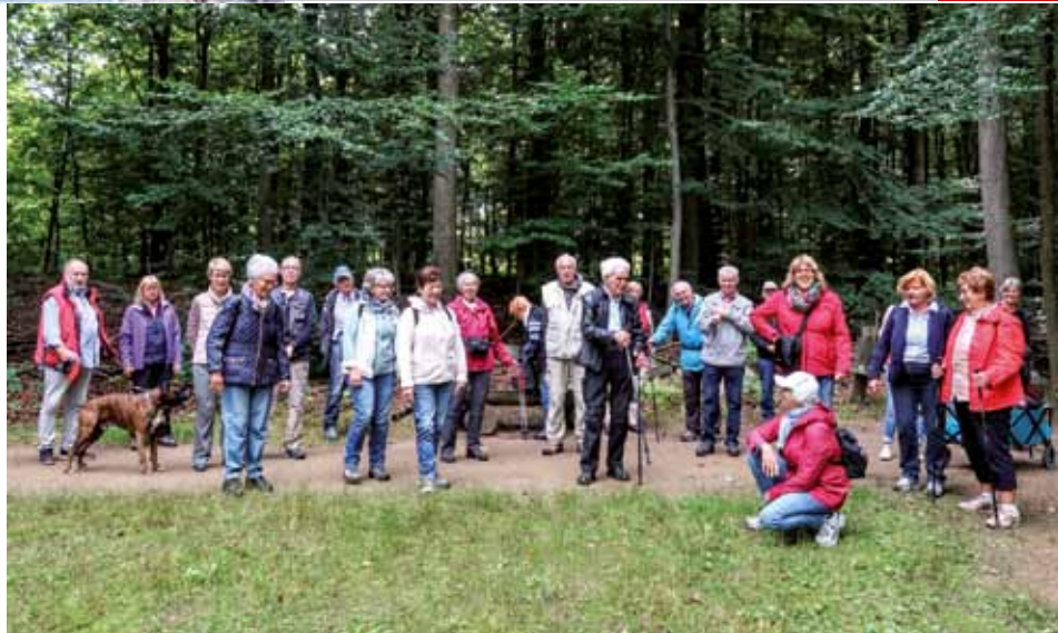
Verschlaufpause im Wohldorfer Wald

Zur alljährlichen Wandertour hat sich auch in diesem September eine ansehnliche Zahl an Mitgliedern der Skiabteilung am Ohlstedter Bahnhof, unserem Treffpunkt, eingefunden. Nach einer kurzen Einführung in die vorgesehene Strecke und die Verhaltensregeln (Abstand)