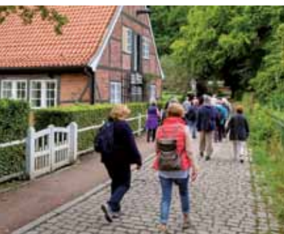
unten: Geschafft! Umtrunk nach dem Gewitter