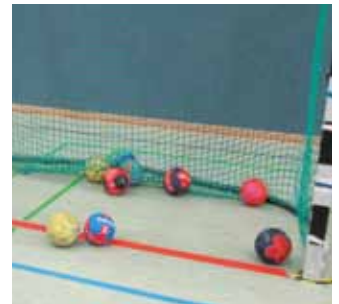
Training, Training, Training ....