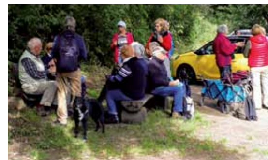
Kleine Rast im Hof des Gutes Wulksfelde