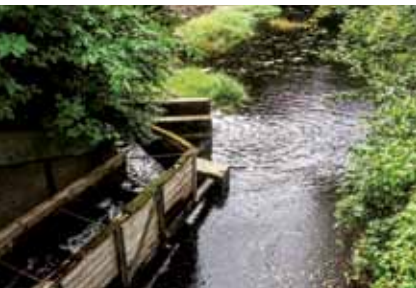
Fischtreppe an der Ammersbek;