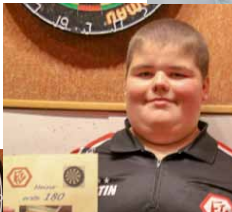
Meine erste 180 geworfen!

geworfen hat. Der Jubel war groß und die ganze Mannschaft gratulierte ihm.